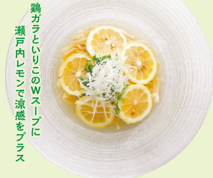
鶏ガラとイリコのWスープに 瀬戸内レモンで涼感をプラス