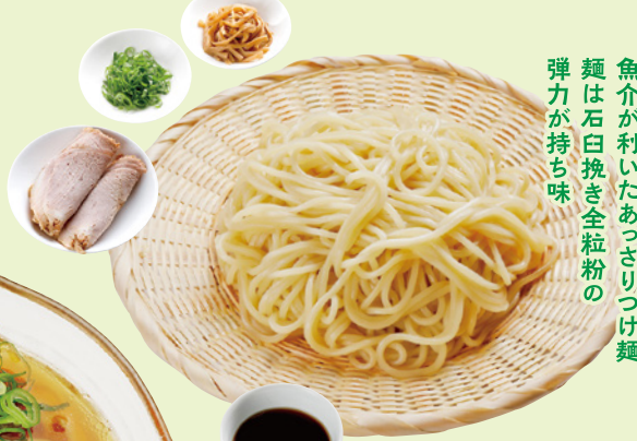
魚介が利いたあっさりつけ麺 は石臼挽き全粒粉の 弾力が持ち味

カツオや昆布からとる出汁に「野尻醤油」を配合した、コク深いつけダレにくぐらせるのは、自家製の極太麺。魚介の風味が小麦の香りを引き立て、石臼挽き「全粒粉」はゆるやかなコシも存分に感じられる。