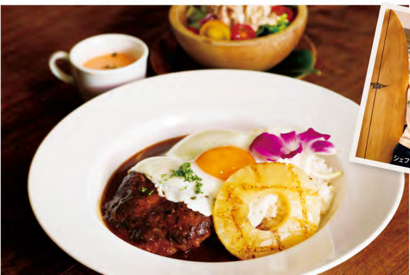
▼ハワイアンロコモコ ¥900 パティと目玉焼き、グリルパンをトッピング。ご飯は玄米が配合されているからヘルシー。ランチタイムは日替わりのスープとサラダ付き。

「本場よりも美味し！」と好評のハワイ料理でリゾート気分を満喫。一步店内に入ると、そこはまるでハワイ！料理もハワイアンをはじめ、トロピカルメニューが満載です。ランチの定番は、ロコモコとハンバーガー。いずれも現地ではファストフードのイメージですが、同店では全て手作りだそう。特にパティは「手ごね」にこだわっているので肉の弾力がパツツ感じられて食べても十分。しかも、フライパンで焼いてオーブンで火を通し、炭火で余分な脂を落としつつ香りをつけるという手間をかけているので、とってもジューシーなんです。時間があれば、カクテルを一杯。昼間からリゾート気分を楽しんでいます(笑)。