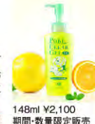
148ml ¥2,100 期間・数量限定販売

毛穴が気になる方、肌をつるつるにしたい方におすすめな顔用角质ケア。週2~3回のお手入れでお肌をつるつるに透明感アップ。夏のお手入れにぴったりなさわやかでリフレッシュ感あふれる香り。(天然精油の香り)期間、数量限定。 ※~8/31