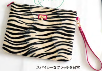
スパイシーなクラッチを日常 コーデの盛り上げ役に任 命しましよ! ゼブラ柄クラッチバッグ ¥6,930