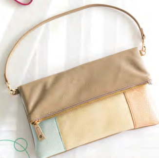
同系色のカラーブロックな ら、派手になりすぎず大人 女子にピッタリ。 配色クラッチバッグ ¥8,925