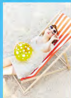
Cover Girl MODEL/DESTINY

本誌掲載記事・写真等の無断複製・複写(コピー)・複製・転載することは、著作権法上での例外を除き禁じられています。