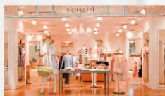
[アクアガール] (06-6348-4613) P36 MAP 47

ビューな気持ちを持ち続ける女性に向けた 日常スタイルを提供し続ける「アクアガール」。 この夏の目玉!ディアモール先行発売アイテムの 登場も見逃せない。