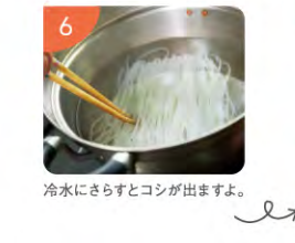
冷水にさらすとコシが出ますよ。