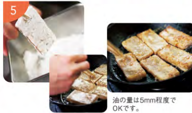
油の量は5mm程度でOKです。