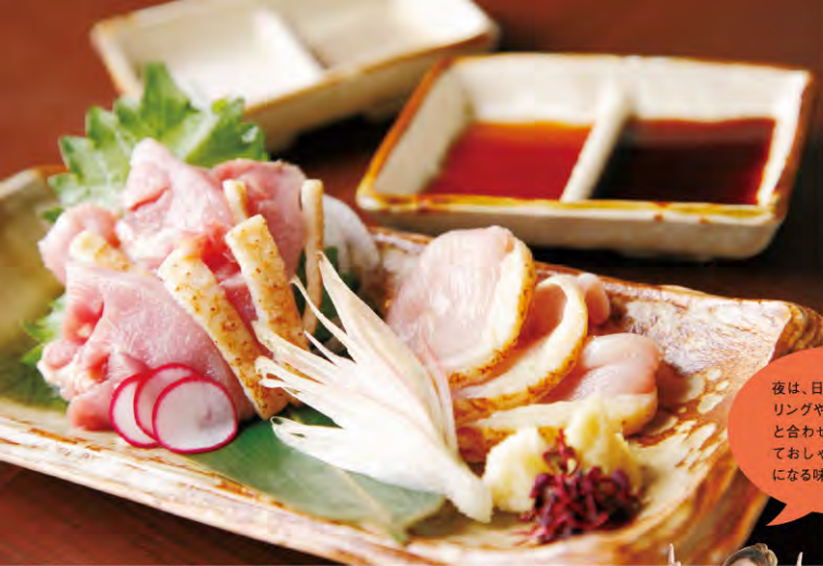
▲うなま山地鶏タタキ ¥682 軽くあぶった新鮮な地鶏のタタキを、さつま醤油、だし醤油、岩塩、ブラックペッパーのトッピングで。色あいや歯ごたえの違いが楽しめます。