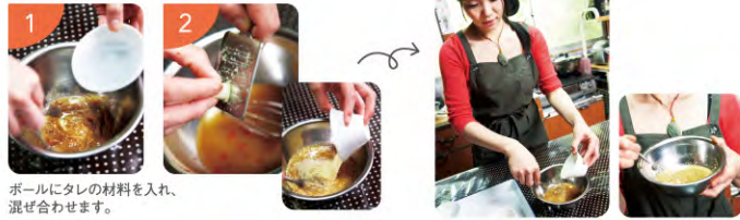
ボールにタレの材料を入れ、混ぜ合わせます。