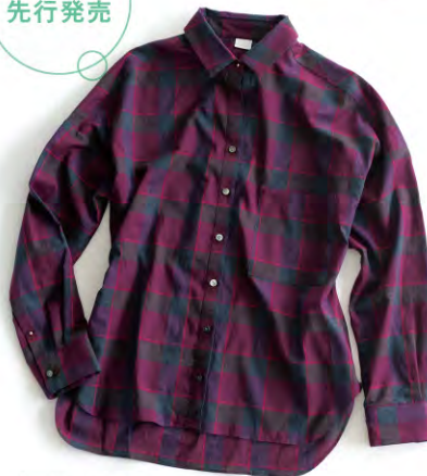
ダークグレー×ボルドーの色使い なら秋まで長く使うことができそう。 2wayチェックシャツ ¥13,650