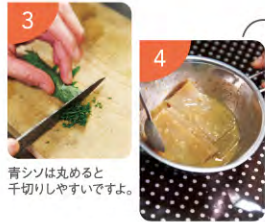
青シソは丸めると千切りしやすいですよ。