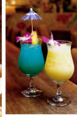
左から) ブルーハワイ ¥945 マンゴーラッシャー ¥735 ハワイの海のような青いカクテルとトロピカルフルーツのドリンクがリゾート気分を盛り上げます。