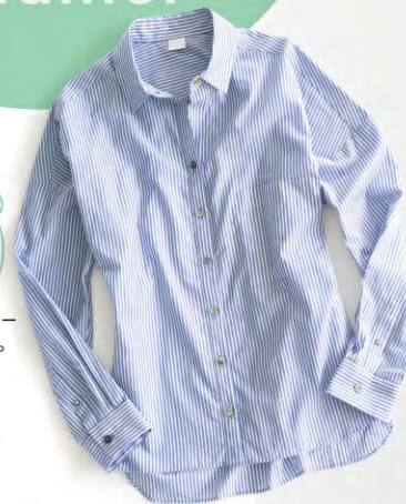
ボタンの開め方次第でカシュウ ールっぽくも着られる2wayデザイン。 2wayスライブシャツ ¥13,650