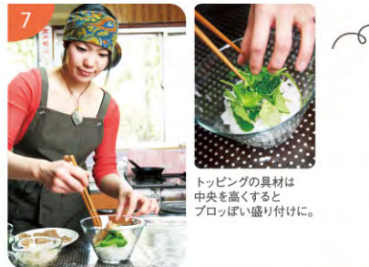
トッピングの具材は中央を高くするとプロっぽい盛り付けに。