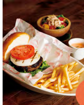
▲カプアニバーガー ¥800 パティ、ロースト玉ネギ、トマトなどが挟まれています。こちらはランチタイムは日替わりのスープとサラダが付きます