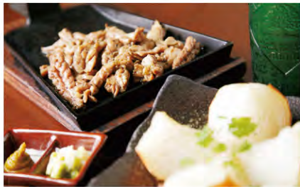
▲上から) せせり炙り焼き ¥714 地鶏のネック部分を、炭で香ばしく焼いた一品。ゆず胡椒をいただくもよし、おろしポン酢のアレンジ(¥157)も人気。玉葱まるごとオリブ焼き ¥472 玉葱の甘さがじゅっりと味わえ、焼き鳥と絶妙なマッチング！

このコーナーでは、梅田界隈で活躍する女性がヘルシーランチのお店をリレー形式で紹介します。今回は私の友人が登場。とっておきのお店情報をお楽しみに！