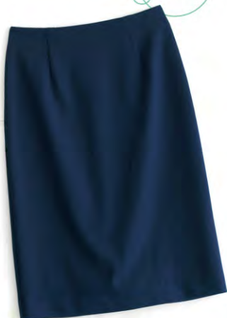
シルエットの美しさもさることながら、 スリット入りで動きやすさ◎。 ジャージタイトスカート ¥9,975