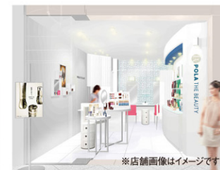
※店舗画像はイメージです

ポーラが全国に575店舗展開している「ポーラ ザ ビューティ」。肌を彩るメーク品から、オーダーメイド感覚のコスメ「APEX-」、5年連続ベストコスメを受賞した「B.A」シリーズまで気になる商品を気軽にお試いただけます。きめ細やかなカウンセリングと、肌を細胞レベルまで分析できる「スキンチェック」(無料)の結果をもとに、美のスペシャリストがお一人おひとりの肌悩みにご提案します。皆さまのご来店を心よりお待ちしております。(tel.06-6348-4675)