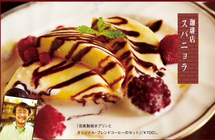
「自家製焼きプリンとオリジナル・ブレンドコーヒーのセット」(¥700)。