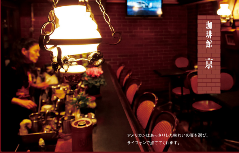
アメリカンはあっさりした味わいの豆を選び、サイフォンで点ててくれます。