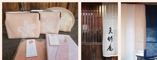
矢的庵 (やまとあん)

※本菜、マクロビオティックでは肉類や卵、乳製品は使用しませんが、このコーナーではあくまでも「マクロビオティックのエッセンスを交えたお弁当」という考え方に基づいて、柔軟性を持ったメニュー開発をおこなっています。