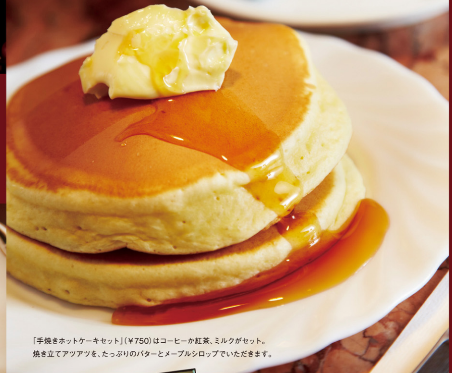
「手焼きホットケーキセット」(¥750)はコーヒーか紅茶、ミルクがセット。焼きたてアツアツを、たっぷりのバターとメープルシロップでいただきます。