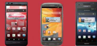
AQUOS PHONE ZETA

対象 「タイプXi にねん」または「タイプXi+ハーディ割引」にご加入の回線においてXiスマートフォンをご購入のお客さま