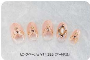
ピンクベージュ ¥14,385 (アート代込)

シンプルになりがちなフレンチも、キラキラ輝くラインストーン やアクセントカラーでオリジナリティをトッピング♡Xmasは 行儀のいいおめかしネイルで攻めてみては、いかが?