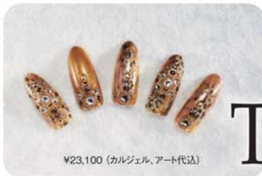
¥23,100 (カルジェル、アート代込)

スワロやホログラムを散りばめたネイルは、 イルミネーションに負けないほどのロイヤル な輝きを放ってくれる。キラキラな爪先は、 彼をドキッとさせてハートをつかむ特効薬。