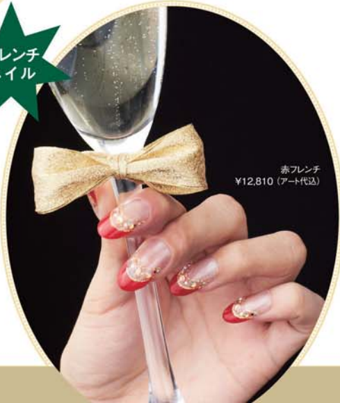
赤フレンチ ¥12,810 (アート代込)