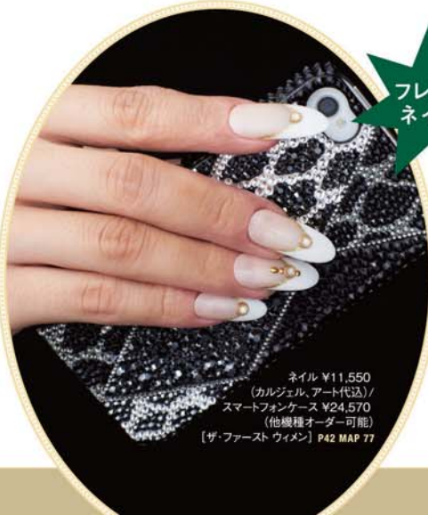
ネイル ¥11,550 (カルジェル、アート代込) / スマートフォンケース ¥24,570 (他機種オーダー可能) [ザ・ファースト ウィメン] P42 MAP 77

ドレスの色やデザインを選ばないフレンチネイルは、 大人の女性にピッタリ。シックな色を選びながらも、 ビジュでアクセントを添えれば、ネイル上級者の称 号はアナタのもの!