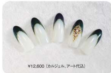
¥12,600 (カルジェル、アート代込)