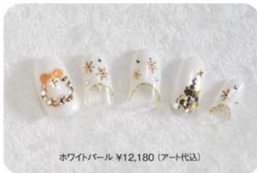
ホワイトパール ¥12,180 (アート代込)

キラキラ輝くラインストーンはいつだって女の 子のハートをくすぐってやまないもの。気分が アがるゴージャス感×Xmasらしいモチーフ で、アナタの爪先を飾ってみたいくない?