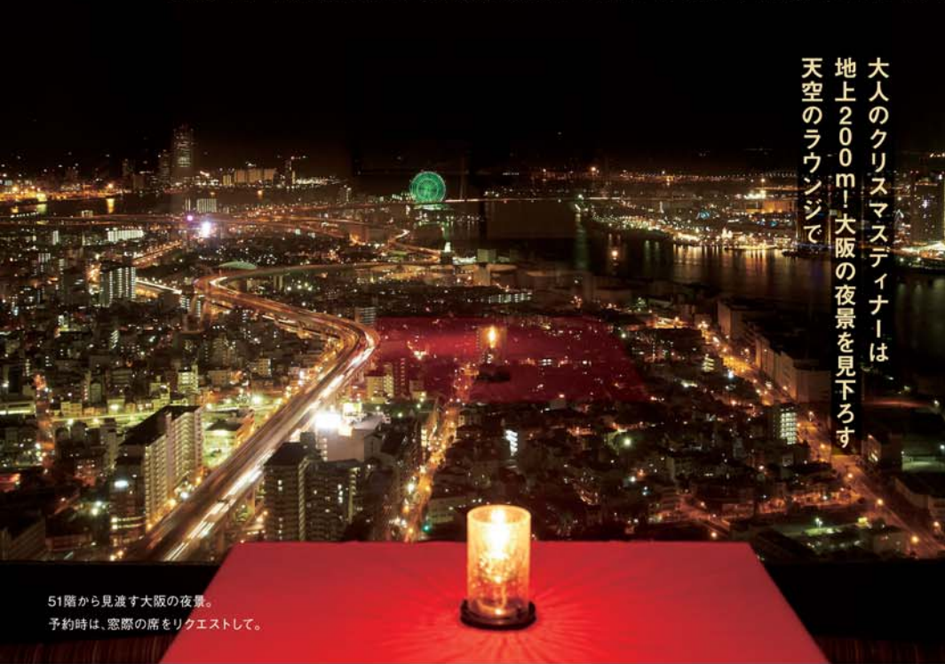
51階から見渡す大阪の夜景。 予約時は、窓際の席をリクエストして。

Xmasディナーは、宝石のようにキラめく夜景を眺めながらシャンパンで乾杯…、なんていうのもロマンティック