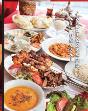
イスタンブールの名産地は、こんなに盛りだくさん!