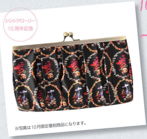
※写真は10月限定復刻商品になります。