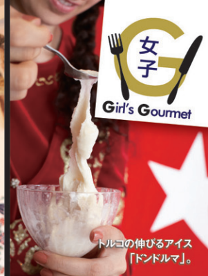
トルコの伸びるアイス「ドンドルマ」。