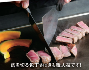
肉を切る包丁さばきも職人技です!