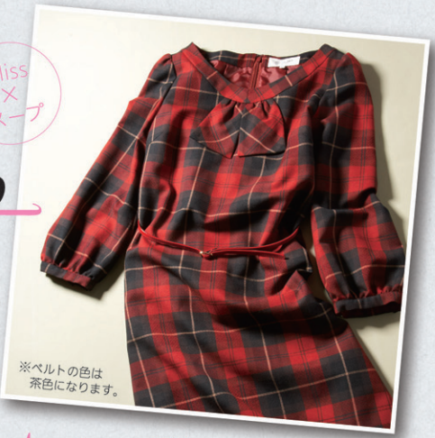
※ベルトの色は 茶色になります。