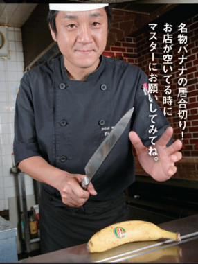
名物ハナナの居合切り! お店が空いている時に、マスターにお願ひしてみね。