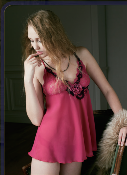
胸元のバラのモチーフが魅力的な、ホルターネックタイプのキャミソール。時にはプライベートタイムにも、魅せるためのオシャレを楽しんでみて。 サルートセットアップランジェリー ¥18,900 [サルート by WACOAL] P42 MAP 26 / ネックレス ¥3,675 [ベントウー] P42 MAP 50

ウエストラインを絞ったシャツと、軽めのデニムのタイトスカートで女性的なシルエットをキレイに出しながら、マスキュリントのタキシードジャケットを凛々しく羽織る。クールビューティーなムードに、手強いクワイアントも降参かも。