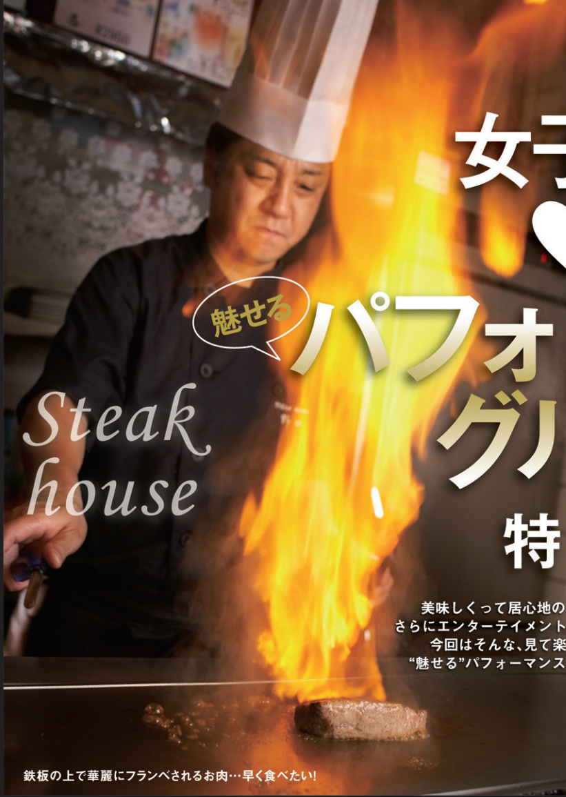
鉄板の上で華麗にフランベされるお肉...早く食べたい!