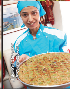
ランチの話もハイの、ミロワ漬け「バクラワ」。