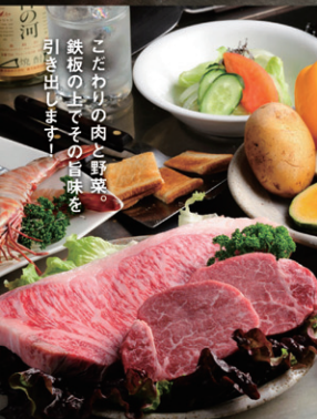
こだわりの肉と野菜。鉄板の上でその旨味を引き出します!