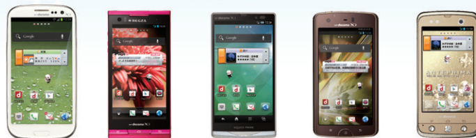
GALAXY S III REGZA Phone AQUOS PHONE ZETA MEDIAS X F-09D ANTEPRIMA