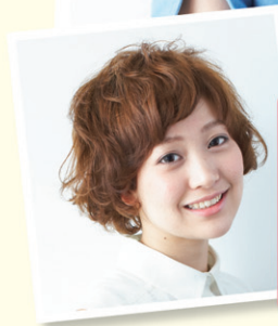
ショートだとこんな感じ

毛先にフェルシェ(やわらかい雰囲気心地よい手触り)シンプルなお手入れパーマをかける