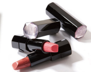
探していたのは、これ。 視線を集める究極ルージュ。 資生堂マキアージュトゥールールージュ 各¥3,150 [美スキ・コスメガーデン] P32 MAP 28