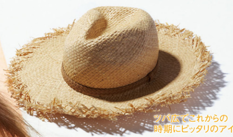
ツバ広でこれからの時期にピッタリアイテム! カットオフフィアHAT ¥6,982 [シブツ] P32 MAP 15