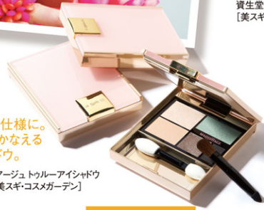
目元も夏仕様に。すべてをかなえるアイシャドウ。 資生堂マキアージュトゥールールージュ アイシャドウ 各¥3,675[美スキ・コスメガーデン] P32 MAP 28