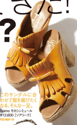
このサンダルに合わせて服を選びたいくなる、そんな一足。 Galmo モカシミュール ¥12,600 [シアリーク] P32 MAP 10