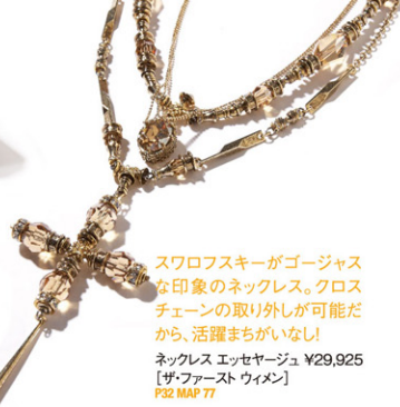
スワロフスキーがゴージャスな印象のネックレス。クロスチェーンの取り外しが可能だから、活躍まちがいなし! ネックレス エッセーージュ ¥29,925 [ザ・ファースト ウィメン] P32 MAP 77