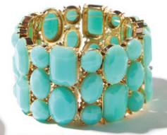
手元に夏を飾る。インパクトのある夏色ブレス。 ブレスレット ¥2,415 [ベントウー] P32 MAP 50