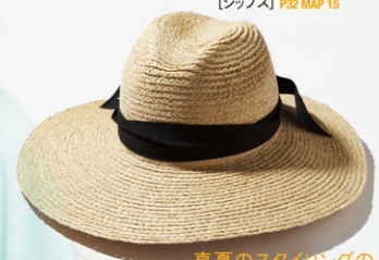
真夏のスタイリングの マストアイテム! MEMAR グログランリボンフィアHAT ¥7,980[ラトータリ] P32 MAP 48