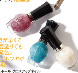
乾きが早く一度塗りでも美発色。ぶっくりツツガが実現! コフレドール グロスアップネイル カラー 各¥945 [美スキ・コスメガーデン] P32 MAP 28