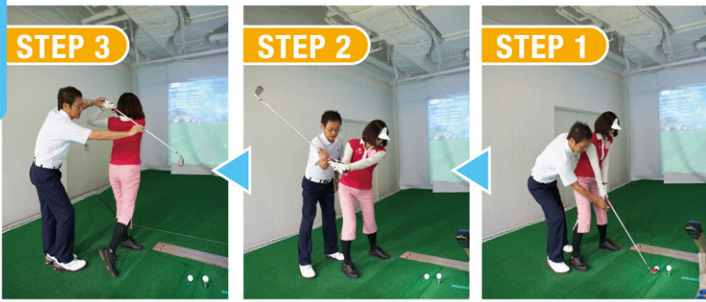
フィニッシュ バックスイング まずはグリップ

初心者から上級者まで、レベルに応じて丁寧にレッスンしてくれるコーチは、ほとんどがPGA(日本プロゴルフ協会)ティーチングプロ資格者なので安心。クラブは最新のミズノ製品を用意しているから、フィッティングも兼ねたレッスンが楽しめる! もちろんここで購入もOKですって。