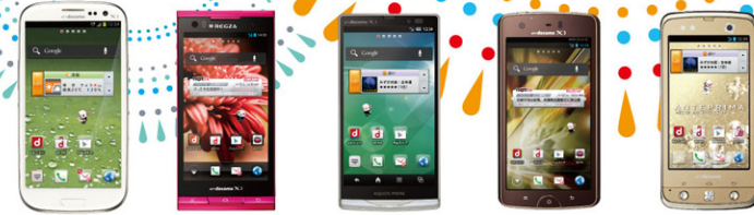
GALAXY S III REGZA Phone AQUOS PHONE ZETA MEDIAS X F-09D ANTEPRIMA