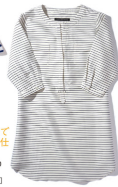
光沢感があり、上品でさわやかな印象に仕上がります。 ボーダーワンピース ¥12,600 [ユナイテッドアローズ グリーンレーベル リラッキング] P32 MAP 76