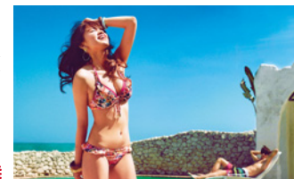
2014 San-ai Swimwear Imagegirl IKUMI HISAMATSU

OPEN記念 水着をお買い上げいただいた先着20名様に、ウォーターブルーケースをプレゼント!