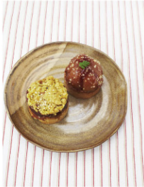
本誌掲載記事・写真等の無断転載・複写(コピー)・複製・転載することは、著作権法上での例外を除き禁じられています。