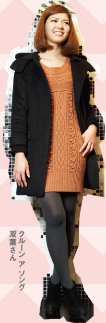
クレーンアソング 双葉さん

フード取り外しコート ¥22,050 → ¥11,025 [クレーンアソング] P18MAP92