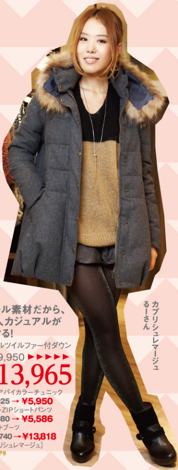
カブリシュレマージュ ーさん

ウール素材だから、 大人カジュアルが キマる! ウールツイルファー付ダウン ¥19,950 ▶▶▶▶▶ ¥13,965 モヘアバイカラーチュニック ¥8,925 → ¥5,950 レザーZIPショートパンツ ¥7,980 → ¥5,586 ショートブーツ ¥19,740 → ¥13,818 [カブリシュレマージュ] P18MAP9