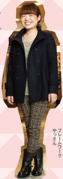
フレームワーク やっさん